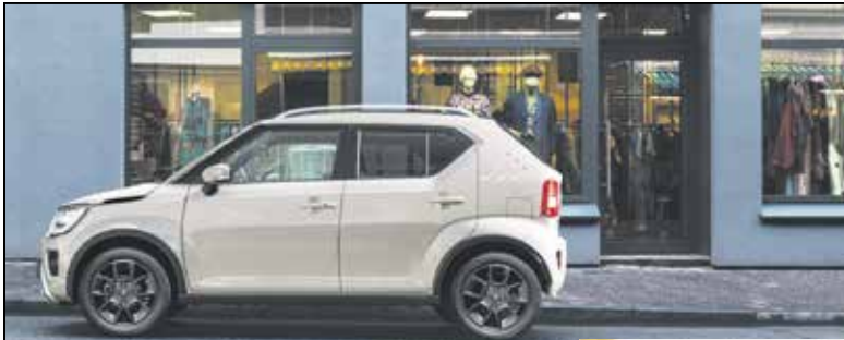
Abbildung zeigt aufpreispflichtige Sonderausstattung.